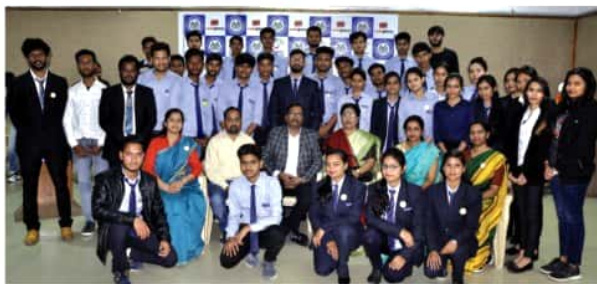
Group Photo at the end of the programme