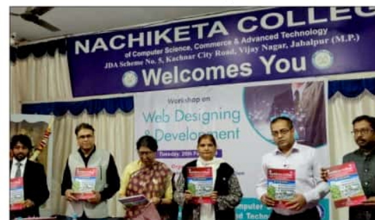
Redemption of At A Glance of Computer Awareness Club